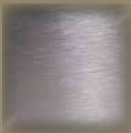
RST - look